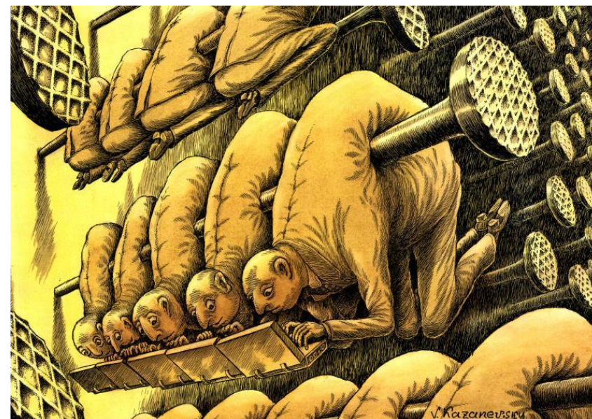
В. Казановский. «Слепые» (фрагмент из цикла «Слепые»).

Мы верим, что наша страна будет процветать и развиваться, что мы сможем построить сильное и свободное государство. Мы верим, что Россия будет процветать и развиваться, что мы сможем построить сильное и свободное государство. Мы верим, что Россия будет процветать и развиваться, что мы сможем построить сильное и свободное государство. Мы верим, что Россия будет процветать и развиваться, что мы сможем построить сильное и свободное государство.