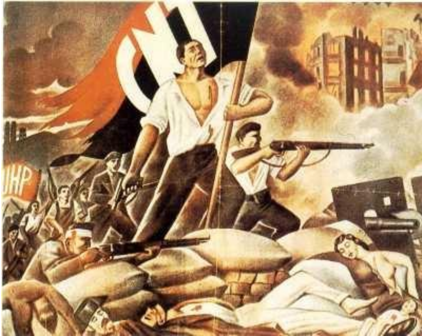
Советский плакат «Родина зовёт»: женщина-солдат

Война была для нас не только борьбой за свободу, но и борьбой за мир. Мы боролись за то, чтобы мир никогда больше не вспыхнул. Мы боролись за то, чтобы мир был справедливым и свободным. Мы боролись за то, чтобы мир был миром.