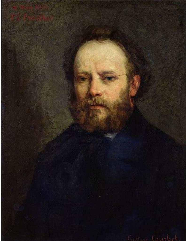
Густав Курбет (1819-1877)

Густав Курбет, французский живописец, скульптор, архитектор, представитель школы реализма. Он родился 10 октября 1819 года в Орнане, Франция. Курбет был одним из крупнейших мастеров XIX века, который стремился к изображению действительности без идеализации. Его творчество было тесно связано с движением реализма, которое стремилось к точному воспроизведению окружающей среды. Курбет был не только художником, но и архитектором, который участвовал в проектировании и строительстве различных зданий. Его работы часто подвергались критике за то, что они были слишком реалистичными и не соответствовали канонам академического искусства. Несмотря на это, Курбет оставил значительное наследие в искусстве, и его творчество продолжает вдохновлять художников и архитекторов по сей день.