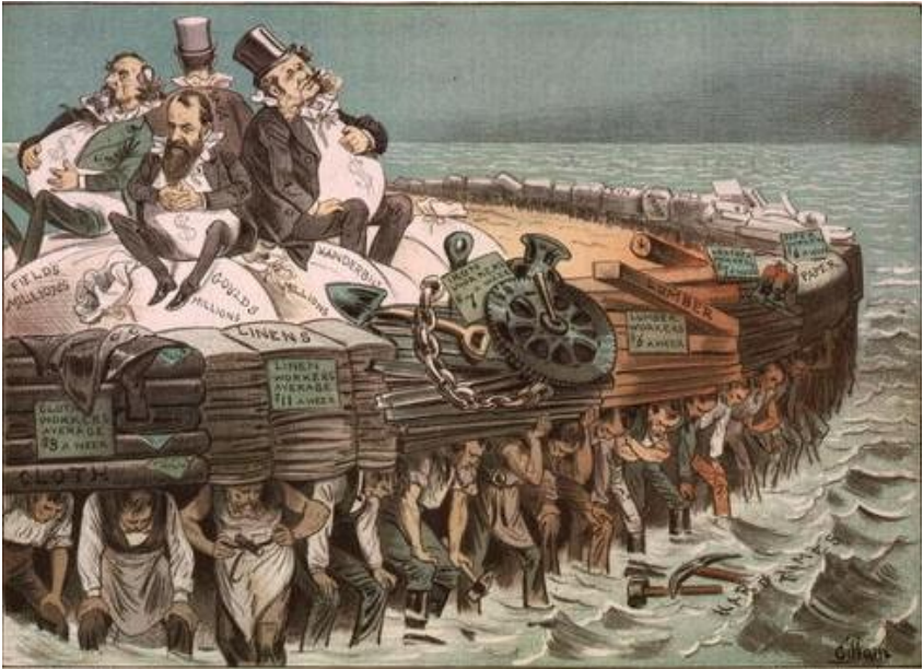
1851年，英國政府為了保護其羊毛貿易， 對羊毛出口實施了嚴格的限制。這項政策導致 羊毛價格飆升，羊毛商人大感不滿。他們認為 政府的干預行為損害了他們的利益。羊毛商 人開始組織起來，要求政府取消限制。他們 認為，羊毛貿易應該自由競爭，政府不應該 干預。羊毛商人的抗議活動引起了政府的注 意。政府最終決定取消羊毛出口限制。這一 決定得到了羊毛商人的歡迎。他們認為，這 是政府對自由貿易的支持。羊毛貿易從此 恢復了自由競爭。羊毛商人的抗議活動也 成為英國自由貿易運動的一個重要事件。

1840年代，英國政府為了保護其羊毛貿易， 對羊毛出口實施了嚴格的限制。這項政策導致 羊毛價格飆升，羊毛商人大感不滿。他們認為 政府的干預行為損害了他們的利益。羊毛商 人開始組織起來，要求政府取消限制。他們 認為，羊毛貿易應該自由競爭，政府不應該 干預。羊毛商人的抗議活動引起了政府的注 意。政府最終決定取消羊毛出口限制。這一 決定得到了羊毛商人的歡迎。他們認為，這 是政府對自由貿易的支持。羊毛貿易從此 恢復了自由競爭。羊毛商人的抗議活動也 成為英國自由貿易運動的一個重要事件。