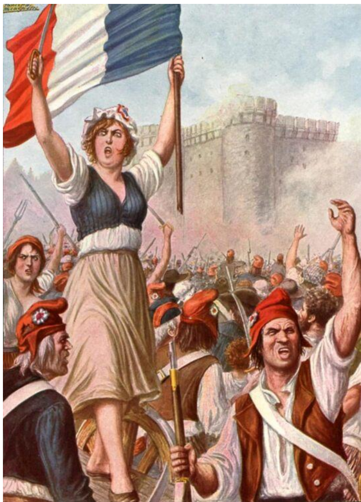
Женщина с французским флагом. Картина Жюль-Энри Лавассье, 1878 г.

В 1871 году в Париже произошло восстание, известное как Коммуна. Это было первое в истории человечества восстание рабочих, которое имело характер общенационального движения. Восставшие парижане создали органы народной власти — Коммуны, которые управляли городом в течение двух месяцев. Коммуна была первой в истории попыткой установить социальную справедливость и демократию. Она отменила сословные привилегии, ввела бесплатное образование и охрану труда. Коммуна также была первой в истории попыткой установить всеобщее избирательное право. Несмотря на то, что восстание было подавлено, оно оказало огромное влияние на дальнейшее развитие рабочего движения и социализма.